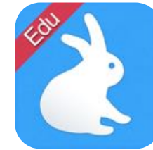
Shadow Puppet Edu