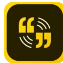
Adobe Spark Video